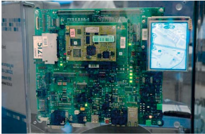
Рис. 2. Отладочный макет GPS/ГЛОНАСС-навигатора под Windows Embedded, представленный компанией Quarta Technologies

Обобщая преимущества платформы Windows Embedded, можно отметить: